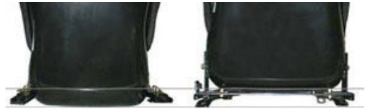
スーパーダウンレール

レールとレールの間にシートを落とし込むタイプ、物理的限界までローポジション可能。